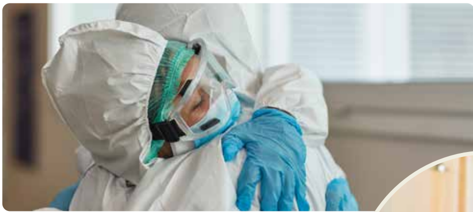
Pandemin visade på brister i välfärden. Vänsterpartiet vill bygga samhället starkt igen.

att välfärden ska bli sämre hela tiden, det beror helt på politiska beslut. Vi måste ta tillbaka kontrollen över skola, vård, omsorg och infrastruktur. Det fungerar inte att ge mindre och mindre pengar till verksamheter som dessutom ska ge en allt större andel av de pengarna till privata bolagsvinster. Det har slagit sönder välfärden och skapat otrygghet.