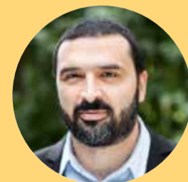
Ali Esbati ekonomisk-politisk talesperson för Vänsterpartiet

Det är det Vänsterpartiet driver på för och det som vi söker stöd för att göra mer av. De som bär upp välfärden i Sverige behöver mer än applåder och fina ord. De behöver fler kollegor och bättre arbetsvillkor. Det kräver en stark och stabil vänsterpolitik för omfördelning, välfinansierade välfärdstjänster och stora investeringar i klimatomställning.