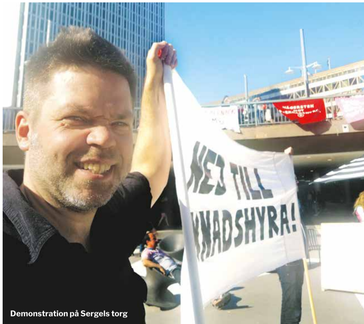
Demonstration på Sergels torg

Den 15 juli 2021 återkallade den nya Stefan Löfven regeringen remissen om fri hyressättning inom nyproduktion. Vad var det som hände?